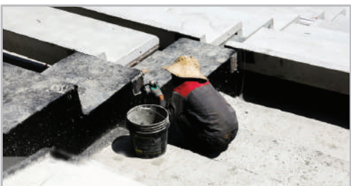
بازسازی ورزشگاه آزادی