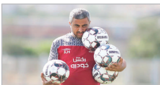
تمرین تیم فوتبال تراکتور و الشارجه امارات