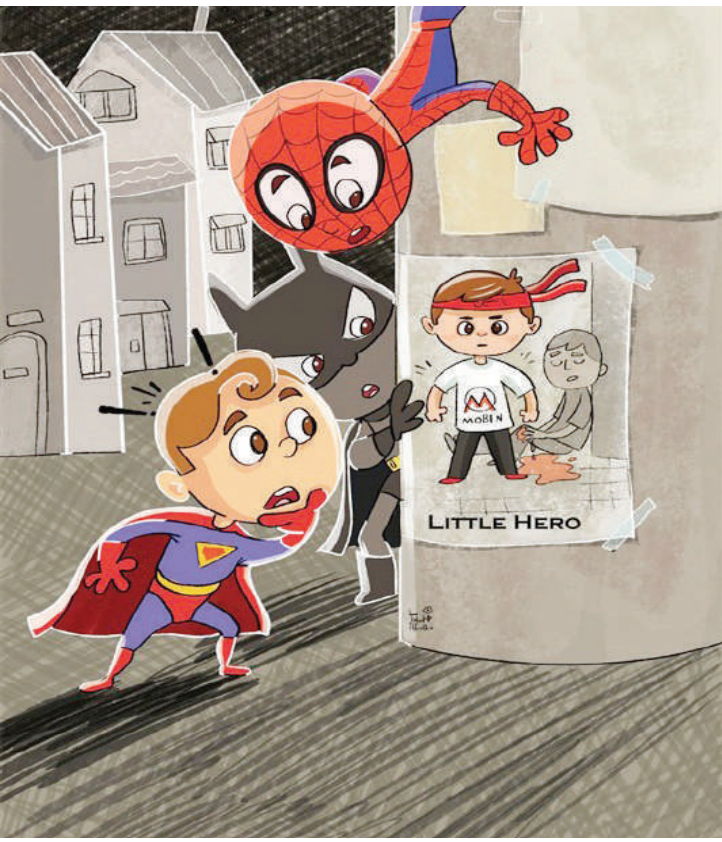
قهرمان کوچک شاهچراغ (ع)