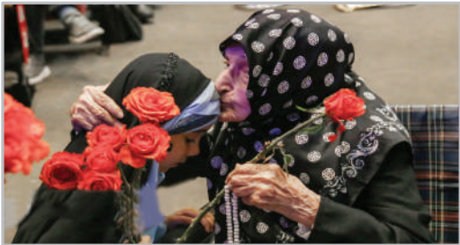
یادواره بانوان شهید پایتخت