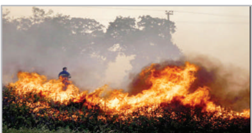
آتش‌سوزی جنگل‌ها و مراتع در یونان